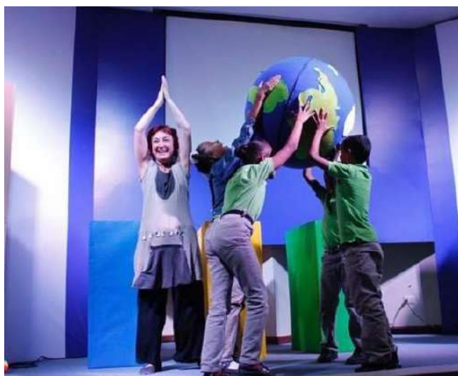
Biblioteca Infantil y Juvenil, República Dominicana