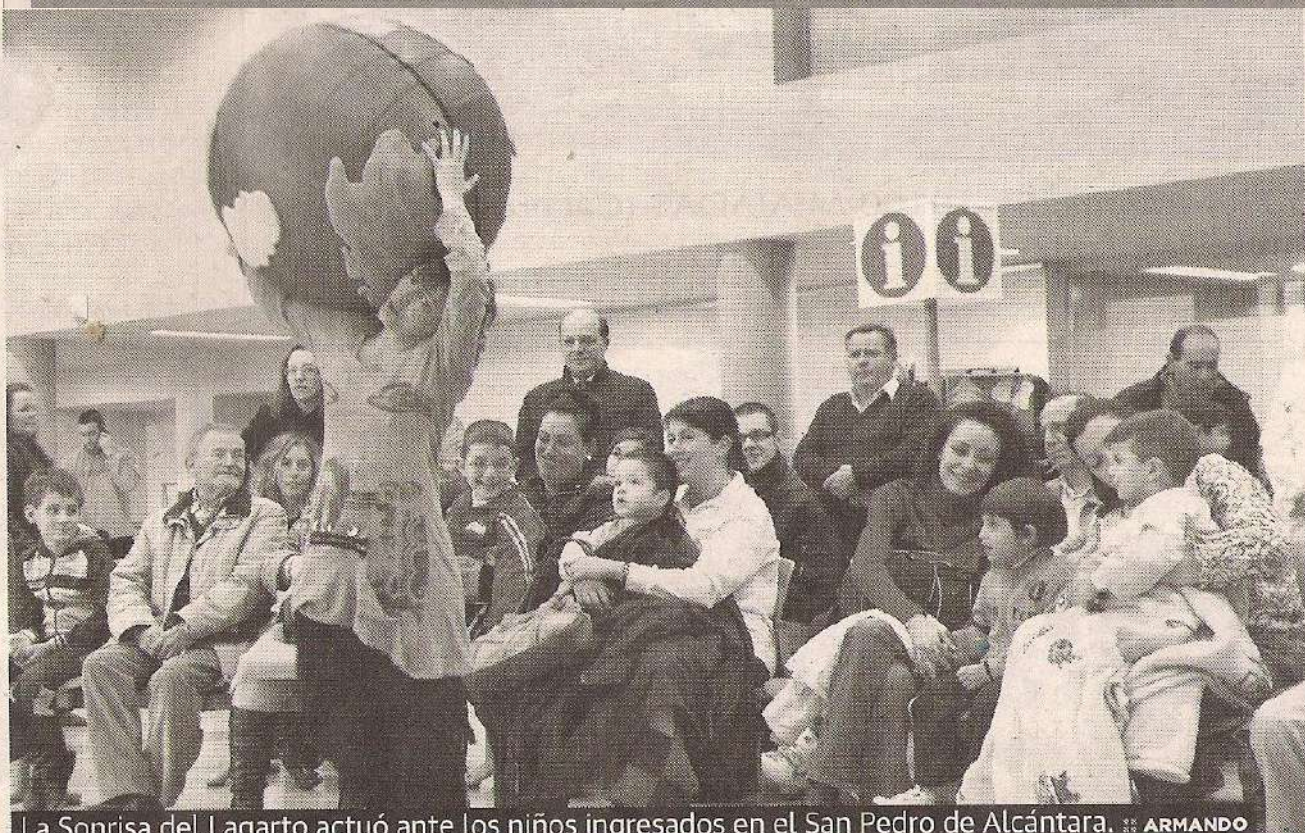
La Sonrisa del Lagarto actuó ante los niños ingresados en el San Pedro de Alcántara. ARMANDO

bre ha actuado ante alumnos de 10 colegios de Cáceres, en Serradilla , en Torrejón el Rubio , en el hotel cacereño Arabia Riad y el pasado jueves hicieron reír a los niños ingresados en el Hospital San Pedro de Alcántara .