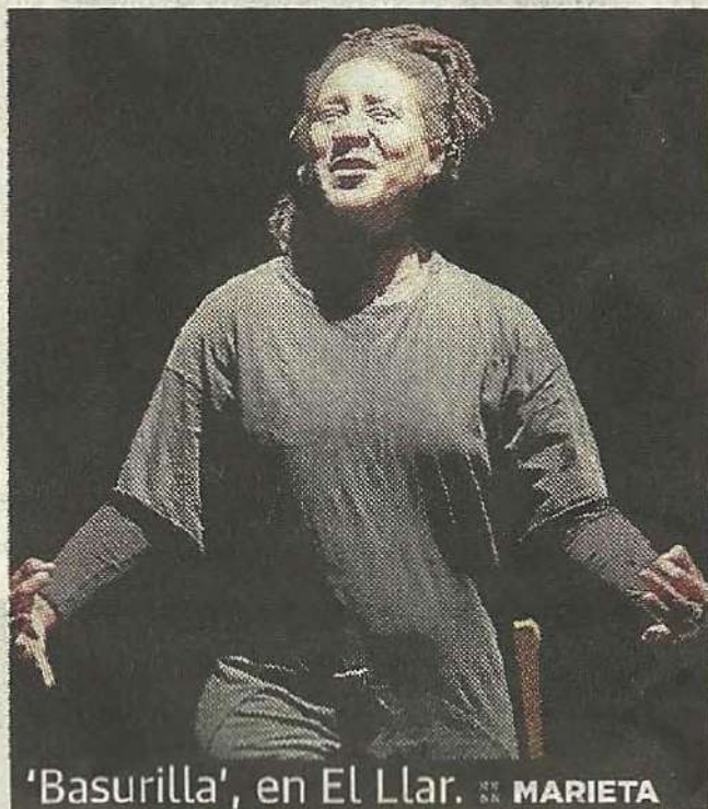
'Basurilla', en El Llar. MARIETA

De la película de Andrew Stanton bebe mucho: como aquel robot, basurilla es una basurera que cuida el medio ambiente, recicla la basura y proyecta inagotable fantasía e imaginación sobre lo